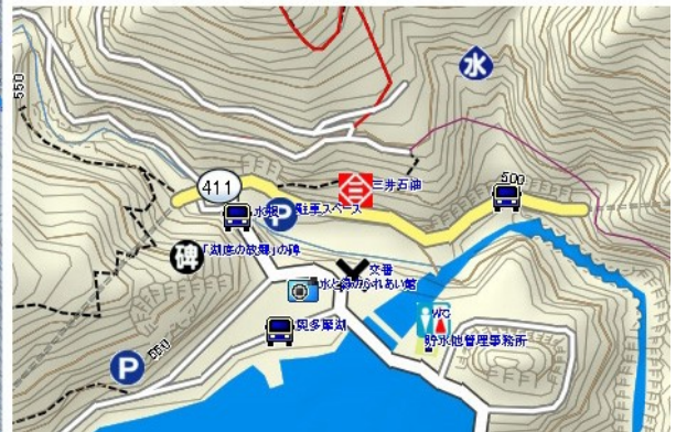
▲『山あるきデータベース』地図イメージ