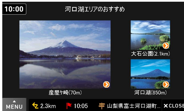
おすすめ情報を写真スライドショーで表示