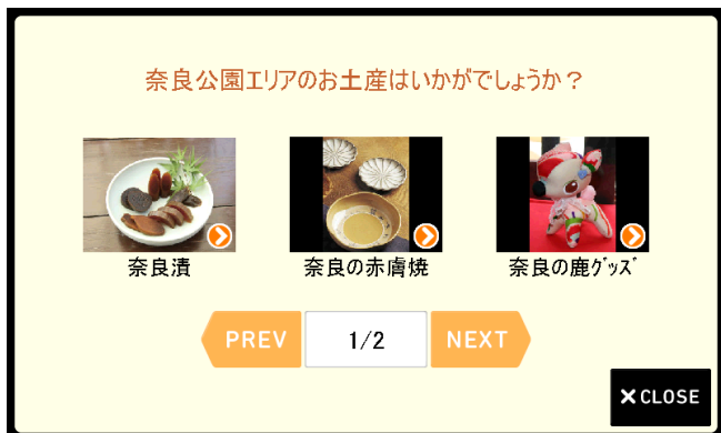
「自宅へ帰る」ボタンを押すと おすすめのおみやげを表示

旅行先から「自宅へ帰る」ボタンを押すと、ナビが自動的に今いる観光地ならではの「おみやげ」をおすすめ。おみやげ探しに悩むことはありません。