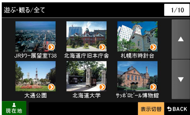
約 12 万枚の豊富な観光ガイド写真を搭載